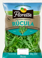
Primeros brotes Rúcula